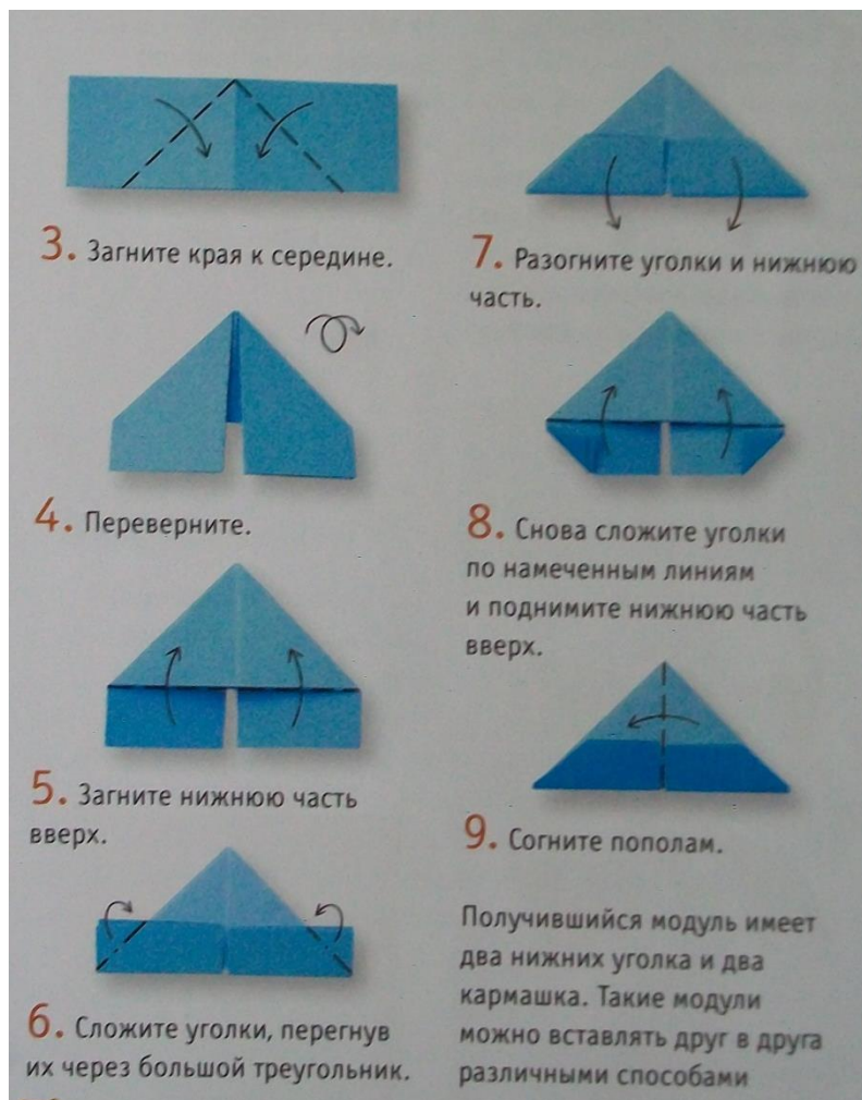
Рис. 8. Треугольный модуль (по книге Просняковой Т.Н.)