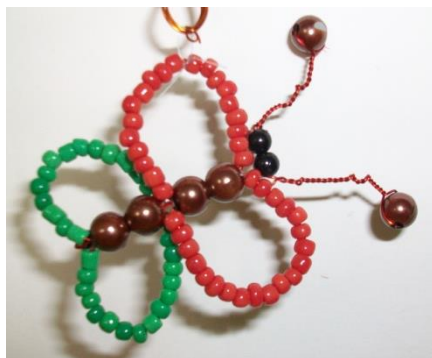
Рис. 6. Бабочки каждого волонтера подарены гостям отряда