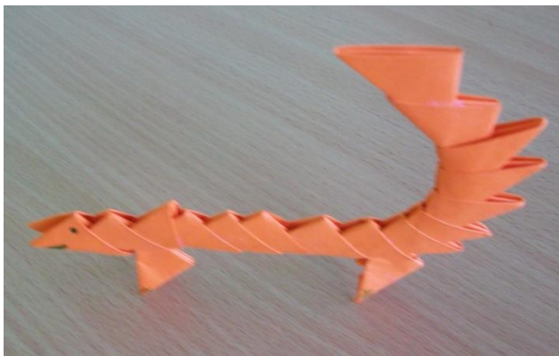
Рис. 10. Лисичка. Авторская работа волонтера А. Лызова

Данный вид деятельности может стать очень интересным совместным занимательным занятием волонтеров и детей-инвалидов, что способствует реализации и развитию творческих способностей и умений общения всех детей.