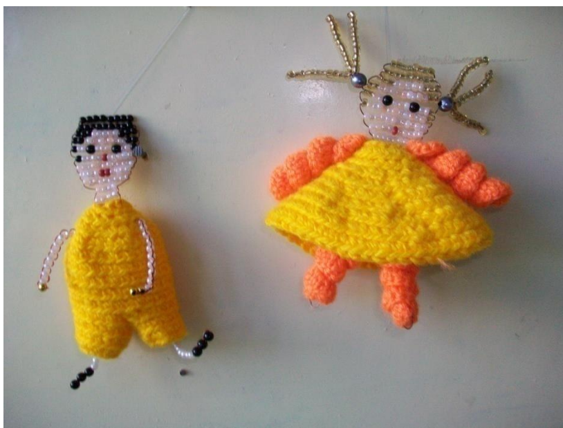
Рис. 7. Талисман отряда - творческая коллективная работа